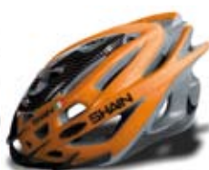
cod. 0512 S/M - 0513 L/XL