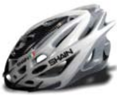
cod. 0510 S/M - 0511 L/XL