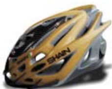
cod. 0502 S/M - 0503 L/XL