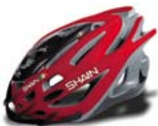
cod. 0504 S/M - 0505 L/XL