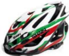
cod. 0471 S/M - 0472 L/XL

Utilizzato da campioni e professionisti di corsa, mtb e triathlon.