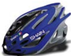
cod. 0506 S/M - 0507 L/XL