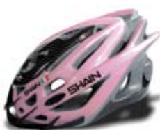
cod. 0508 S/M - 0509 L/XL